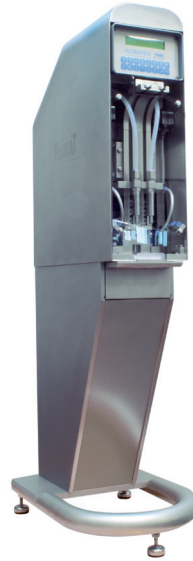
PLÜMATEX-BFM 007 | SFC

PLÜMATEX-BFM 007- SFC настольная машина для наполнения и укупорки пакетов с SFC-системой (одно-функциональный порт), которая изобретена и запатентована фирмой PLÜMAT. Пакеты и колпачки подаются в машину вручную. Все остальные операции выполняются в автоматическом режиме.